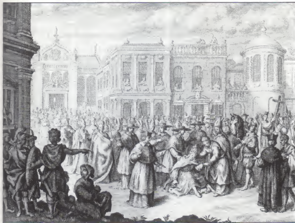
Gravure uit: Het leven van Pausin Johanna, Amsterdam 1722. Johanna brengt haar kind ter wereld.

Coll. Bibliotheek Rijksuniversiteit Leiden